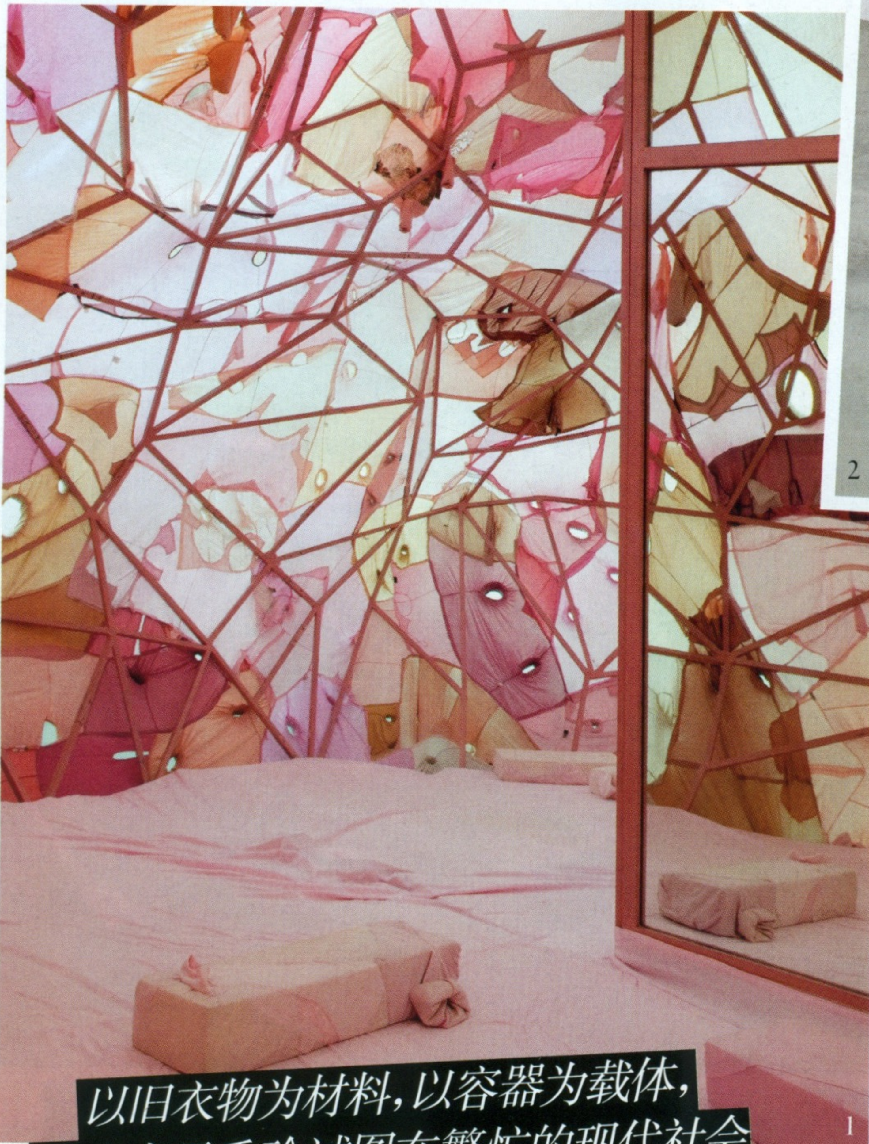
以旧衣物为材料,以容器为载体,艺术家尹秀珍试图在繁忙的现代社会为人们创造一片关注内心、获得治愈的净土。