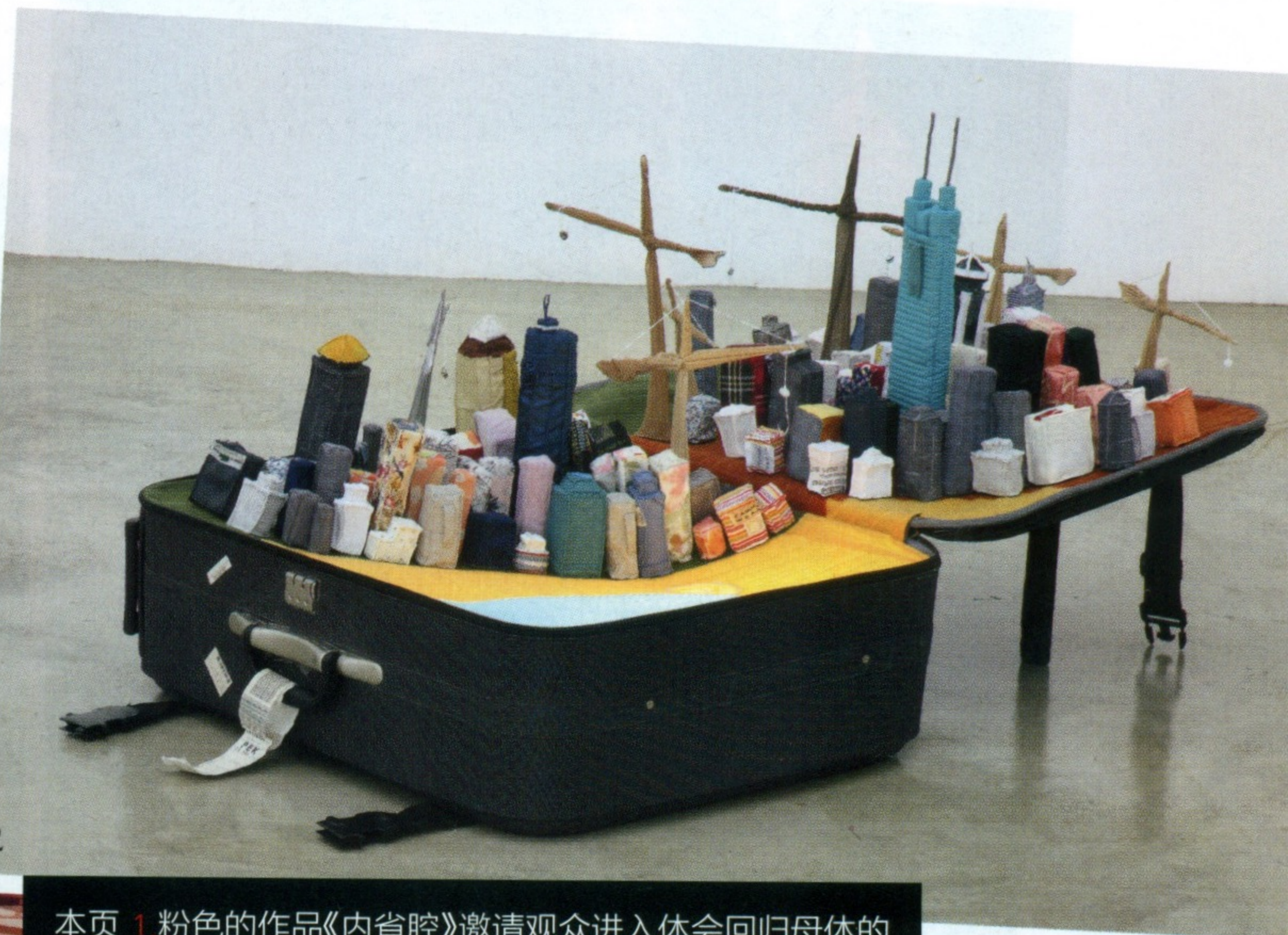
本页 1.粉色的作品《内省腔》邀请观众进入体会回归母体的感受。2.尹秀珍2008年创作的《可携带的城市:深圳》。3.尹秀珍用1000条围巾创作的装置《不能承受之暖》。4.由Snejana Krasteva策展,尹秀珍创作的大型装置《缓释》于2016年在莫斯科车库当代艺术博物馆展出现场。

么做呢?我慢慢就对旧衣服感兴趣了。”对她来说,这些被人穿过的布料记录了复杂而真实的信息,携带着原主人的气息,保留着一段珍贵的个人记忆,同时也反映着彼时的生活状况、社会背景乃至价值观。“我认为收集旧衣物就是在收集人们的经历。旧衣物犹如一种社会皮肤,我把它们重新缝制在一起,形成一个新的集体。”织物之塔底部的另一个意象“旅行箱”则可回溯到尹秀珍持续发展的作品系列“可携带的城市”。在这一系列作品中,她同样大量采用旧衣物作为材料,缝制成不同城市的建筑形体,再把这些“建筑”放进旅行箱这个容器之中,暗示随着生活节奏的加快,在不同城市间辗转停留成为越来越多人们的常态。