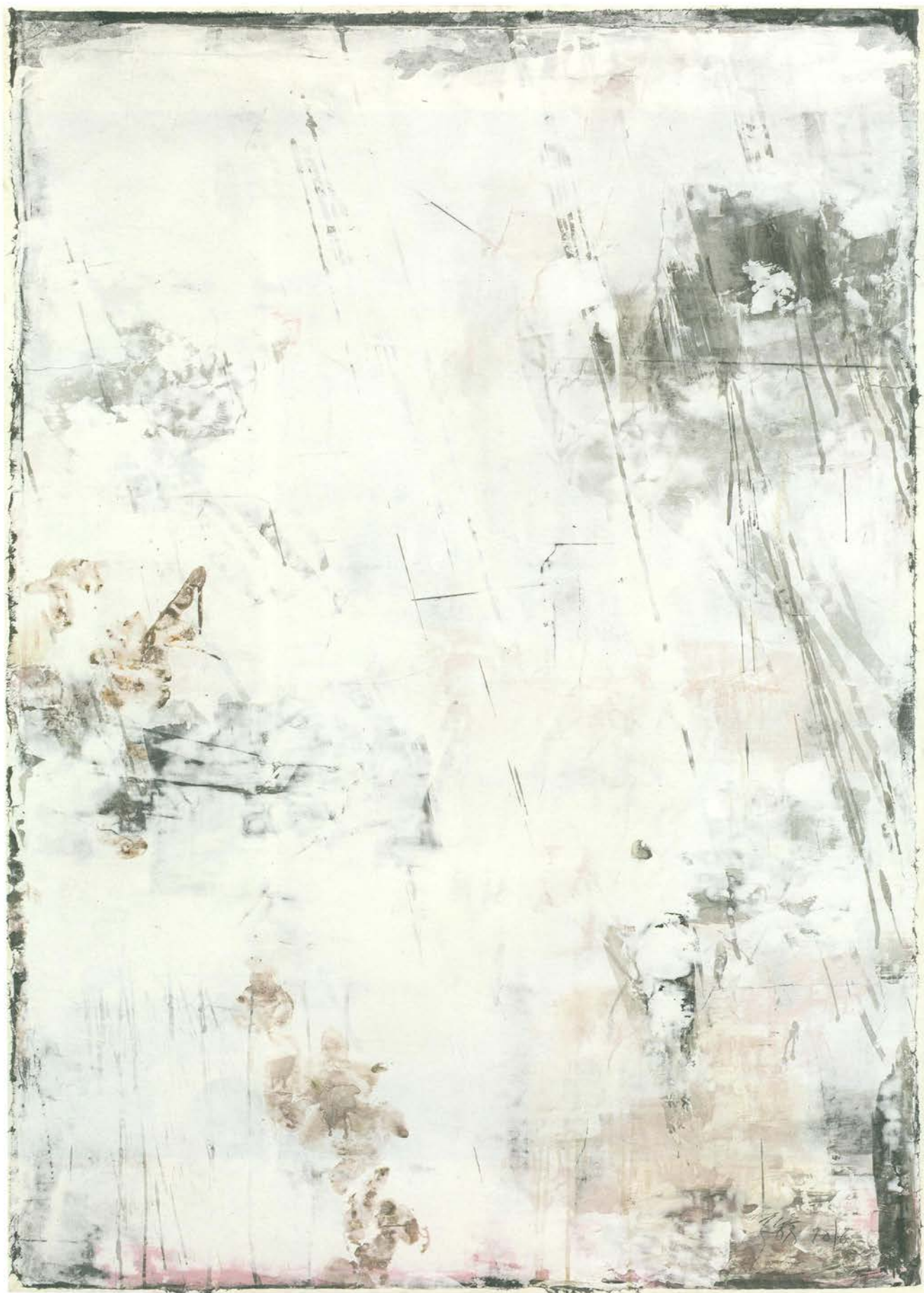
严善錞 湖上 No.07