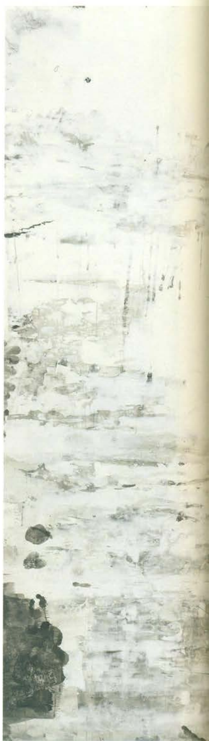
严善錡 湖滨 No.20