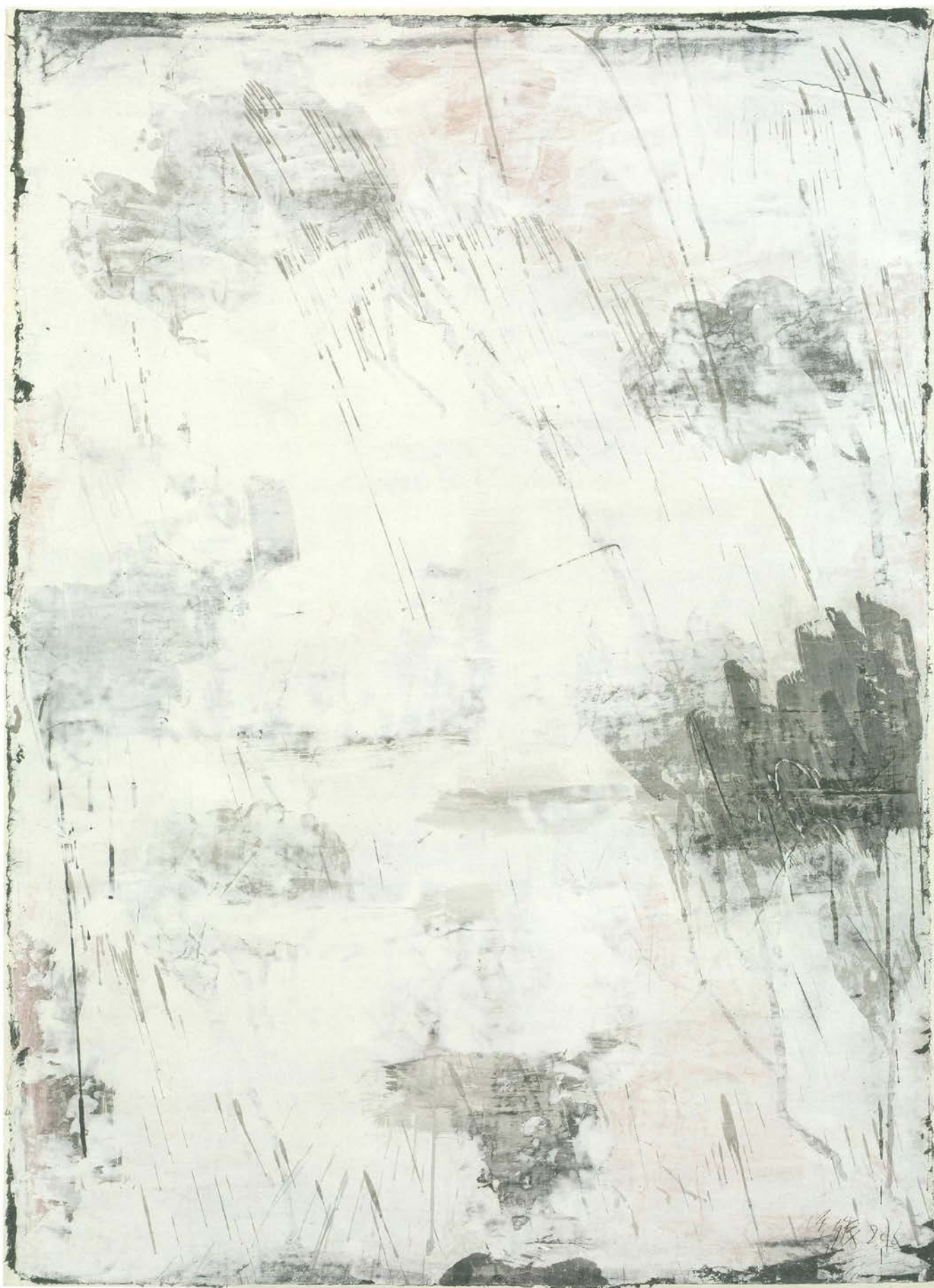
严善錞 湖上 No.04