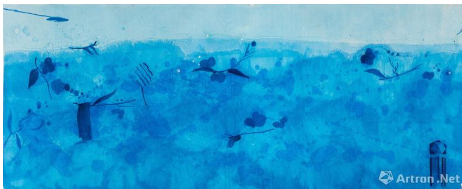
Figure 6 王公懿，《尤利西斯》，2015，生宣、水彩，144 x 367 cm (56 3/4 x 144 1/2 in)

吴冠中先生有一本文集叫《笔墨等于零》，是针对当时美术界以笔墨技法为作品优劣标准的批评。笔墨仅是工具，岂可舍本逐末，漠视整体大局。他认为一位艺术家应当寻找一切手段，不择手段，以能贴切地表达内心的感受，而成为杰作，则其画面所使用的任何手段，便具有点石成金的作用与价值。王公懿的温莎蓝系列即是最佳的例子。她用最少的元素、最简单的方式捕捉了生命及自然界中又抽象、又具体的元素：水的漂浮、山的呼吸、气息的流动、光的记忆、时间的过度；在重复与变化的蓝色韵律中，表达了生命的基调与变奏、澄静与吟咏、浑然与虚空，让我们看见精炼、冷静、如诗般的声音。