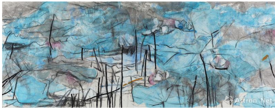
Figure 9 王公懿 《大荷》，2016， 生宣、综合媒材 146 x 362 cm (57 1/2 x 142 1/2 in)