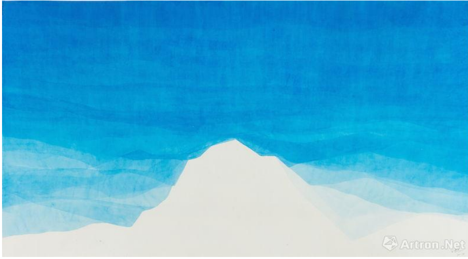
Figure 7 王公懿 《知其白》，2017， 蝉翼宣、水彩 94 x 171 cm (37 x 67 1/4 in)