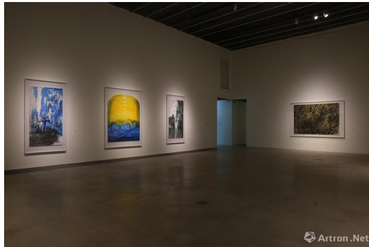
Figure 5 王公懿个展现场

舒展开阔的平行线像远山、像海浪、像云霭、像风吹过的沙痕，像舒缓流动的气息。上面的白色图案，像鸟、像鱼、像帆、像音符，这些可爱跳跃的符号是她在法国见到一幅石版印刷的古乐谱，上面的音符十分特别，她用相机记录下来，巧妙的放在这幅作品。