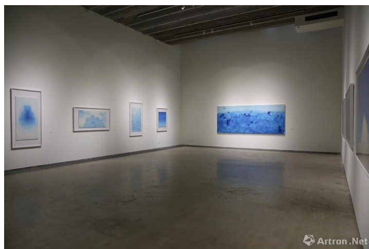
Figure 4 王公懿个展现场

从 2004 年开始是王公懿创作上的一次高峰，新的实验与题材层出不穷，令人惊艳。这几年当中，她解开了许多身心上的束缚，思想上的桎梏，年轻时郁结的愤怒与悲痛也一点一点地溶化消失，回到她内在的本质本性，那愉悦自由和蓬勃的生命力很自然地流泻在她的作品里。她于 2005 年偶然中开始用温莎蓝单色作画，从此一发不可收拾，至今仍乐此不疲，忽而抽象、忽而山水、忽而花卉。每次看到她的作品，总是为其精微纯粹的美所感动，顿时尘躁一空，进入清凉境；站在画前，满目澄蓝，一纸清澈透明，令人想要深深吸一口气。